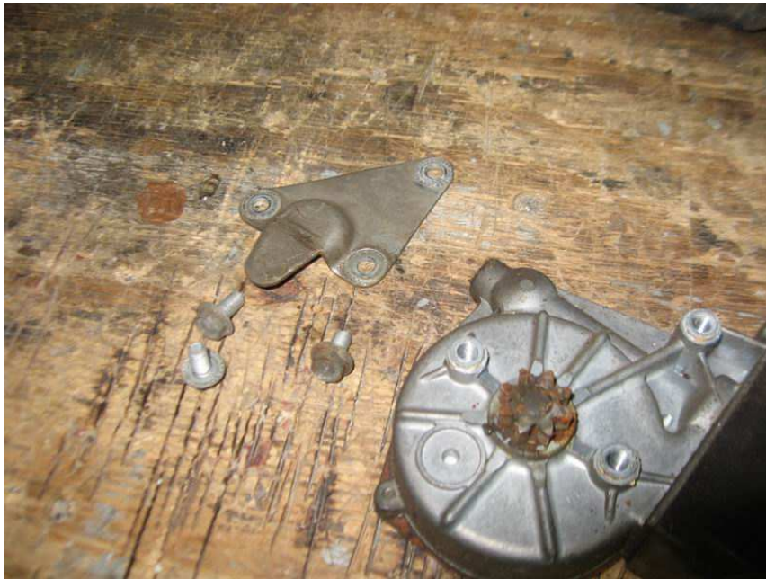
Original Motor E9 ohne Abdeckkappe