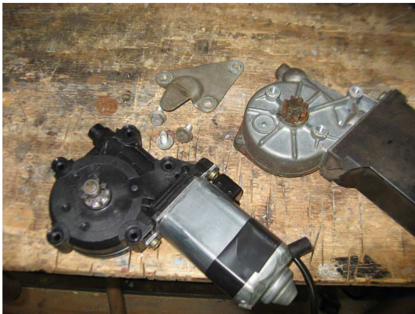
Original Motor E34 (Bild unten) original Motor E9 (Bild oben)