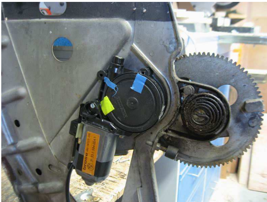
Motor mit M4 x 30mm Schraube in vorhandenes Loch befestigen (gelbe Markierung) Grundplatte mit 2 neuen 4mm Bohrungen versehen (blaue Markierung)