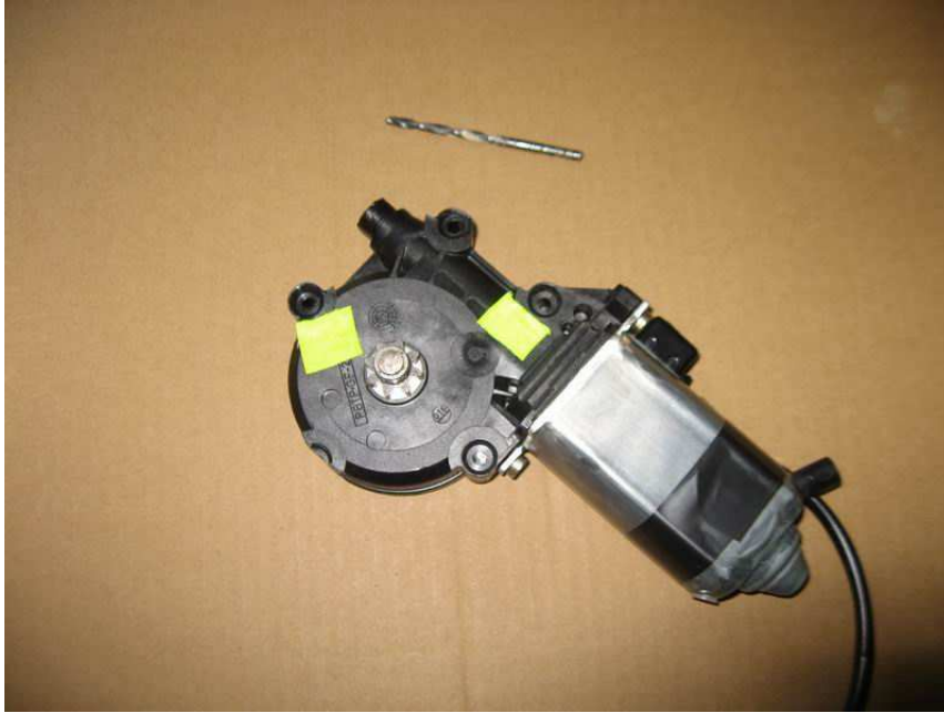
3. & 4. Befestigungshülse mit 4mm Bohrer aufbohren (gelbe Markierung)